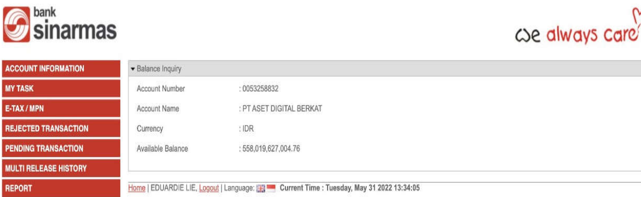
Gambar 1. Screenshot Rekening Koran untuk Jaminan BIDR (31 Mei 2022) Figure 1 : Bank statement screenshot for collateral BIDR (May 31, 2022)